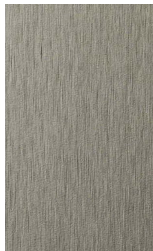
3951-TO Titanium Brushed Horizontal