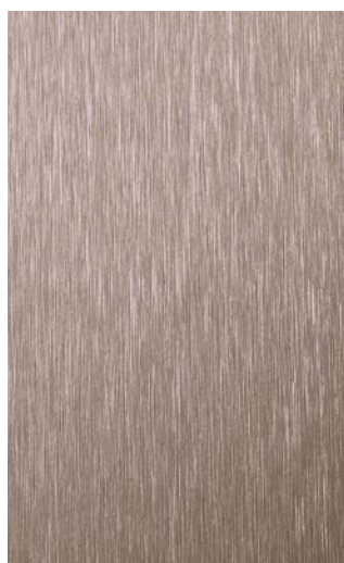
3902-GB Copper Brushed