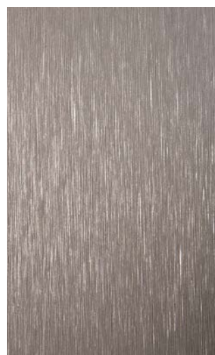
3903-GB Titanium Brushed