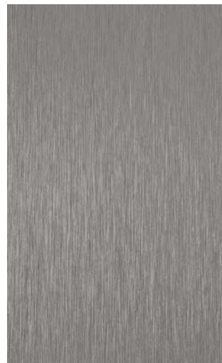
3906-TM Titanium Traceless Metal